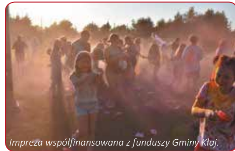
Impreza współfinansowana z funduszy Gminy Kłaj.

Serdecznie dziękujemy za przygotowanie pikniku, w szczególności Rodzicom, którzy przyczynili do zorganizowania imprezy, pracującym dzielnie od rana przy rozstawianiu sprzętu, obsłudze gości, pięknym ciastem. Dziękujemy nauczycielom, którzy przeprowadzili zawody sportowe i wraz z rodzicami przygotowali przedstawienie.