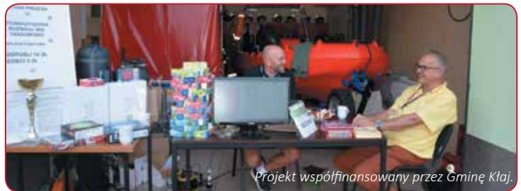
Projekt współfinansowany przez Gminę Kłaj.