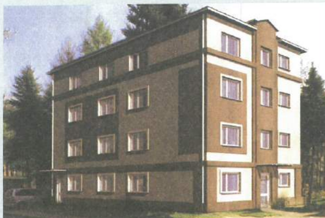
Tak wkrótce będzie wyglądał budynek, sąsiadujący z Urzędem Gminy

Trwa remont drogi krajowej nr 75 w Targowisku, łączącej drogę nr 4 z budowanym zjazdem z autostrady A4. Zmodernizowany zostanie prawie 2-kilometrowy