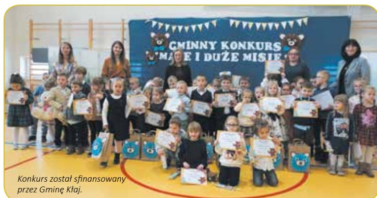
Konkurs został sfinansowany przez Gminę Kłaj.

Podczas obrad komisji konkursowej przedszkolaki, zgromadzeni na widowni nauczyciele przedszkoli, a także rodzice, mieli czas na poczęstunek. Dzieci radośnie wzięły udział w aktywności ruchowej z wykorzystaniem chusty animacyjnej, plastycznej – kolorując portret misia, a chętni mogli wykonać sobie pamiątkową fotografię w fotobudce.