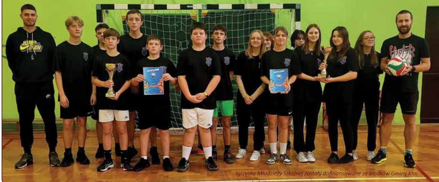
Igrzyska Młodzieży Szkolnej zostały dofinansowane ze środków Gminy Kłaj.